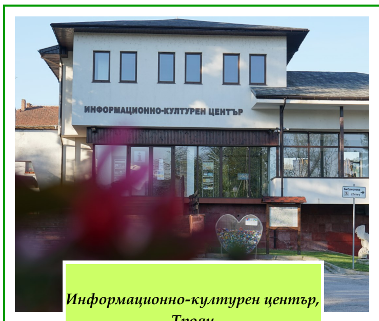
Информационно-културен център, Троян